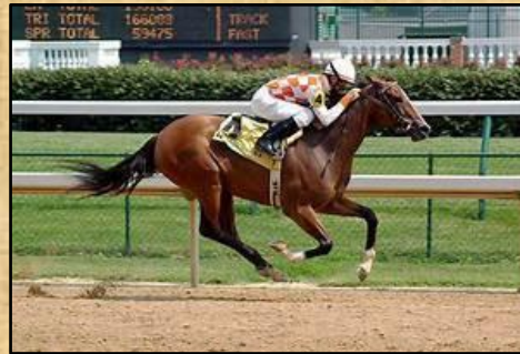
Le Pur Sang